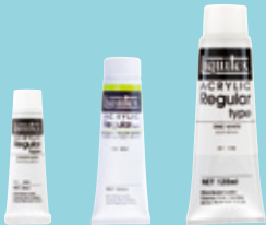
20ml チューブ 60ml チューブ 120ml チューブ