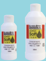
120ml ボトル 240ml ボトル